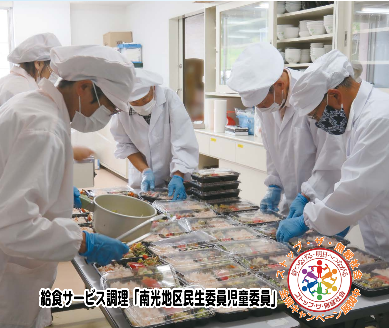
給食サービス調理「南光地区民生委員児童委員」