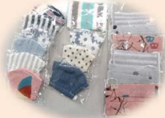
たおるぼうしの会 他 ▲