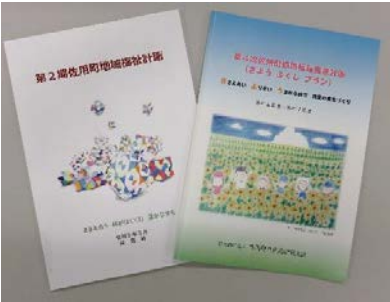
2つの計画の連携が重要

地域福祉推進のための基盤や体制をつくる地域福祉計画と、それを実行するための、住民の活動・行動のあり方を